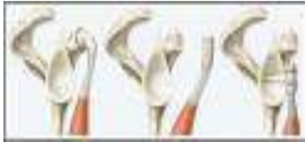
stabilizzazione sec. Latarjet